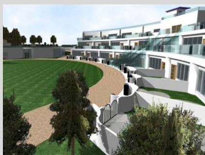
卒業制作 Vector Works, Photo shopで作図

CADソフトとして、建築・インテリア業界で広く使われている、JW-cad, Vector Works, Auto CAD を習得します。また、CADソフトで作成した図面をプレゼンするためのPhoto shop, Power Point などの操作技術も学びます。