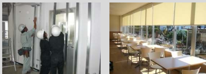
平成20年「食堂リニューアルプロジェクト」 大学食堂のリフォームを、設計から施工にいたるすべての工程を行いました。

実際の建物を建設し、インテリアもデザインする事によって、教室で学んだことをより深く理解できる実習。一般のカリキュラムではなかなか学ぶことができない仕事に必要な知識・技術を学べるようになっています。